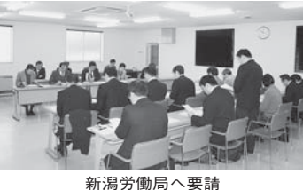
新潟労働局へ要請