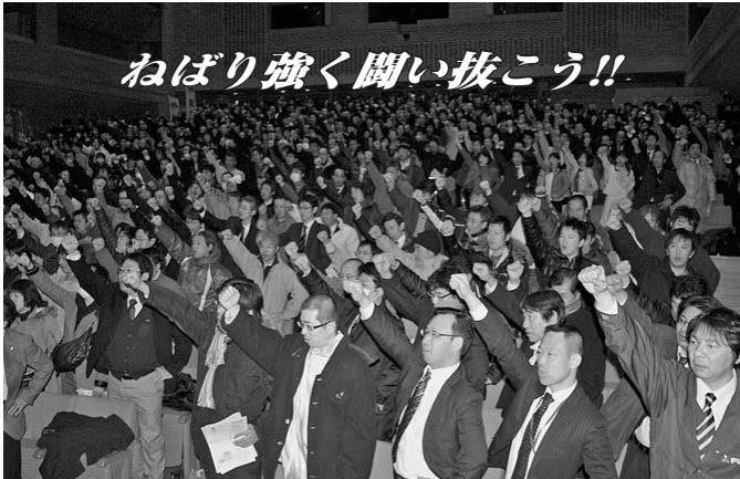
ねばり強く闘い抜こう!!

2011年度予算と予算関連法案の早期成立を求める緊急アピール 来年度予算およびその関連法案をめぐる国会情勢は、重大な局面を迎えている。政府予算案は、3月1日に衆議院本会議で可決され、参議院で審議中である。一方、税制改正や特別公債法案、子ども手当法案や求職者支援法案等、予算の執行に不可欠な関連法案は、いまも衆議院で難航している。 予算および予算関連法案が年度内に成立しなければ、予算執行が滞り、国民生活やわが国経済社会が混乱するのは必至である。国際的な信用も低下し、混乱に拍車をかけ、国益を損ねる恐れもある。与野党ともに国民のくらしを守るべき政治を遂走させ、生活と雇用のみなす将来への不安を助長しているのは極めて問題である。 われわれは、政府・与党に対し、政権政党としての重責を肩にし、一致団結してあらゆる努力を傾注し、予算および予算関連法案の年度内成立の速を切り拓くことを求める。また、野党に対しては、審議にただちにない、建設的な議論を集中的に行うことを求める。年度内成立を阻止することで政府の主導権を握らうとするような、無責任な対応では国民の支持は得られない。 来年度予算と関連法案の早期成立の取り組みは、「働くことを軸とする安心社会」を実現するための第一歩である。そして、連合の政策実現能力の真価が問われる課題である。われわれは、こうした認識をそれぞれの職場・地域・家庭で共有し、国民が主役の政治を実現すべく、その力を結集していく。連合は、すべての働く者の期待に応えるべく、結集した力を背景にあらゆる場を通じ、来年度予算および予算関連法案の年度内成立を働きかけていく。 2011年3月3日 2011春季生活闘争勝利! 新潟県中央総決起集会