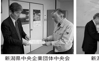
新潟県中央企業団体中央会