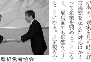
新潟県経営者協会