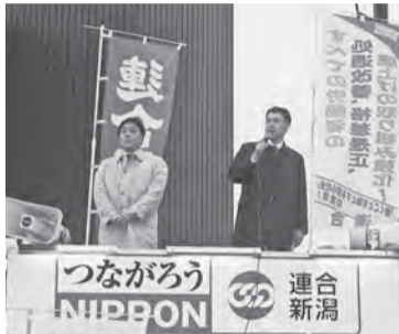
上越市で連合新潟の活動を訴え

5月以降はあなたの街にもうかがいます。一緒に働きやすい社会・職場の実現に向けて呼びかけましょう!