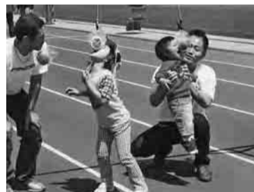
パパと一緒にパン食い競争

柏崎地区メーデーは四月二十八日、柏崎市みなとまち海浜公園に約七〇〇人が集結して開催され、市内をデモ行進しました。 式典は、柏崎市市長、刈羽村長、社会福祉協議会会長、驚尾衆議院議員から来賓挨拶を頂き、柏崎地協推薦の市議会議員団、労働金庫、総合生協からも出席していただきました。