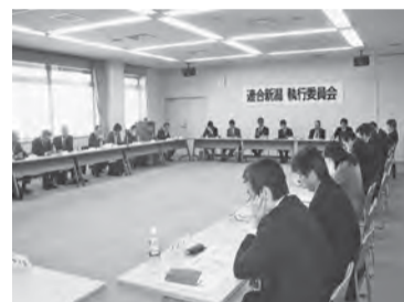
執行委員会にあわせて開催

三月二日に、新潟県議会議会平成二十四年二月定例会が閉会し、「平成二十四年度新潟県予算」が可決されました。 今年度の予算は「経済・雇用対策に努め、明日の新潟の飛躍につなげる」と「災害からの復旧・復興と原子力災害への対応」などが大きな特徴となっています。 四月一八日に連合新潟政策委員会主催による「政策