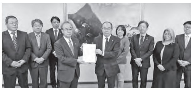
花角知事に要請書を手交

新潟県知事への要請では、花角知事から「県としても、人への投資、適切な価格転嫁の促進に対する課題認識は同じであり、適切な価格