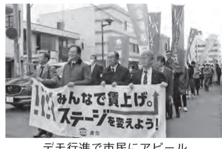
デモ行進で市民にアピール

短時間・契約などで働く仲間を含めてみんなで賃上げし、経済も物価も賃金も安定的に上昇する経済社会へステージを変えよう！