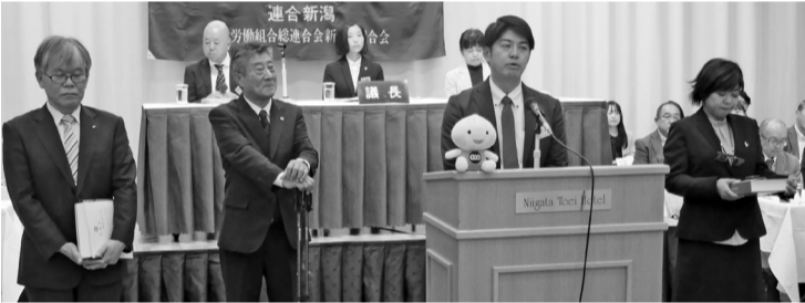
退任役員の皆さんお疲れさまでした

YouTubeチャンネル 『連合新潟TV』 定期大会の会長あいさつも こちらから！