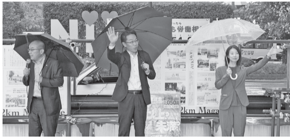
最低賃金のさらなる引き上げと履行確保を訴えました