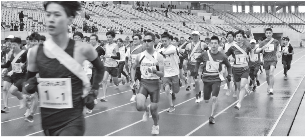
第1走者がスタート