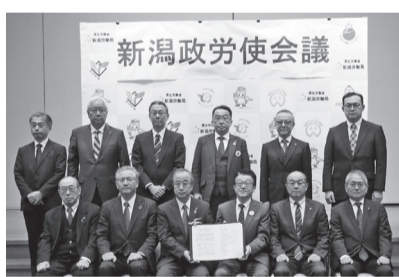
政労使会議共同宣言

2月19日、新潟市内で「賃金引上げ、価格転嫁に向けた取組」をテーマに、新潟政労使会議が開催されました。今年も働き方と環境改善で生産性の向上、人材の確保・定着につなげ、それを持続的な賃上げにつなげる循環とするため、