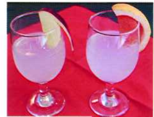
寒天ドリンク 各380円 グレープフルーツ味 りんご味