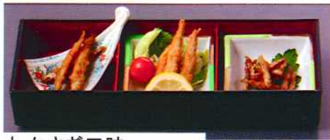
わかさぎ三味 500円 (南蛮漬、フライ、甘露煮)