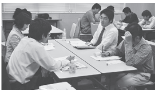
魅力ある組合にするには？ グループディスカッション