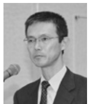
船山代議員 (自治労)