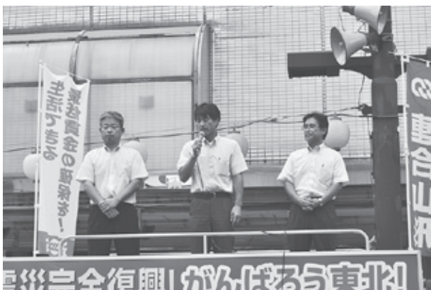
生活できる最賃を！街宣行動