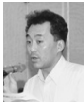
足達代議員 (県教組)